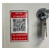
QR Code : contact PC sécurité (Sivaé)