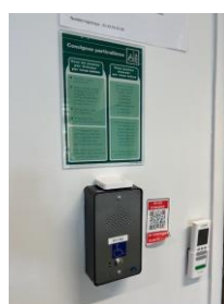
Interphone pour appel du PC Sécurité